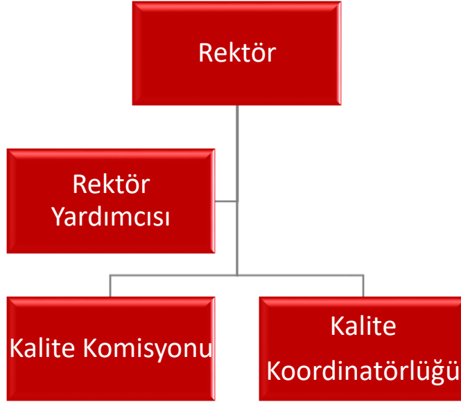
Şekil 2: Kalite Güvence Sistemi Organizasyon Şeması

meslek yüksekokulunu temsilen birden fazla olmamak üzere farklı bilim alanlarını ve idari birimleri temsilen akademik ve idari personel, merkez müdürlüklerini temsilen ilgili rektör yardımcı ile öğrenci konsey başkanından oluşan Kalite Komisyonu kurulmuştur. Ayrıca Üniversitede kalite güvence yönetim sisteminin kurulması ve yönetilmesi amacıyla Rektörün görevlendireceği bir koordinatör başkanlığında öğretim elemanları ve idari çalışanlardan oluşan en az iki (2) koordinatör yardımcısının görevlendirildiği Kalite Koordinatörlüğü oluşturulmuştur.